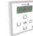
Sélecteur Óptima+ Sélecteur pour le contrôle de la porte automatique.