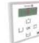
Sélecteur Optima+ Sélecteur pour le contrôle de la porte automatique.